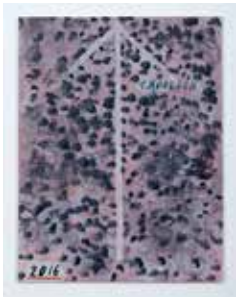
Untitled, 2016 oil on board 42 x 30,5 cm unique