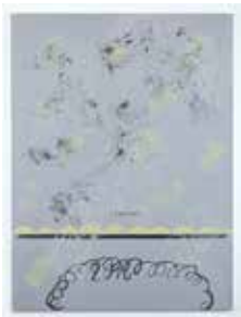
Untitled, 2016 acrylic on canvas 140 x 105 cm unique