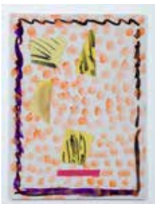
Untitled, 2016 acrylic on board 42 x 30,5 cm unique