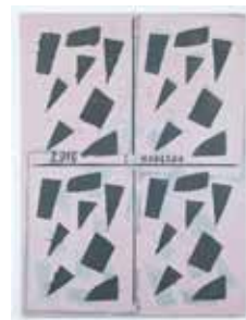
Untitled, 2016 acrylic on canvas 140 x 105 cm unique