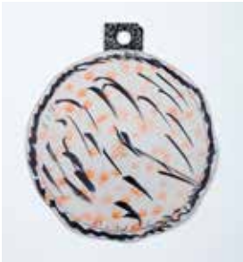
Untitled, 2016 acrylic on paper 30 x 26 cm unique