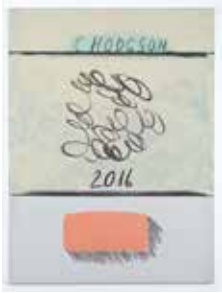
Untitled, 2016 acrylic on canvas 140 x 105 cm unique

TATJANA PIETERS NIEUWEVAART 124 / 001 B - 9000 CHENT T +32 9 324 45 29 INFO@TATJANAPIETERS.COM WWW.TATJANAPIETERS.COM