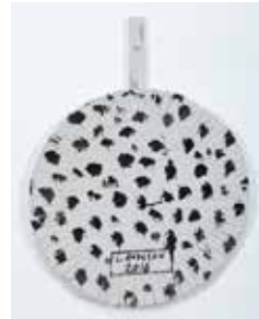
Untitled, 2016 acrylic on canvas on board 39 x 30 cm unique