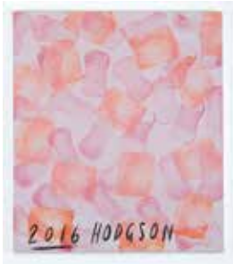
Untitled, 2016 acrylic on canvas 81 x 71,5 cm unique