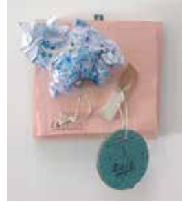
Untitled, 2016 acrylic on cardboard, paper, wood, string 27 x 23 x 8 cm unique