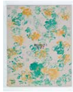
Untitled, 2016 acrylic on canvas 50,5 x 40,5 cm unique