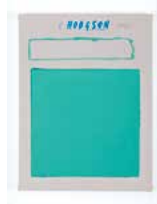
Untitled, 2016 acrylic on canvas 40,5 x 30,5 cm unique