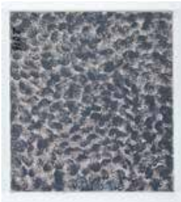
Untitled, 2016 acrylic on canvas 50,5 x 40,5 cm unique