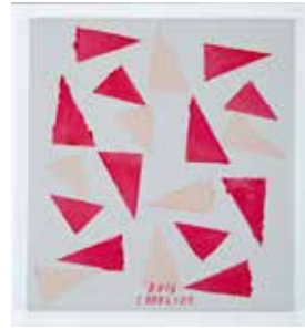
Untitled, 2016 acrylic on canvas 55 x 50 cm unique