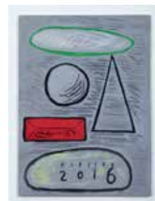
Untitled, 2016 acrylic on board 42 x 30,5 cm unique