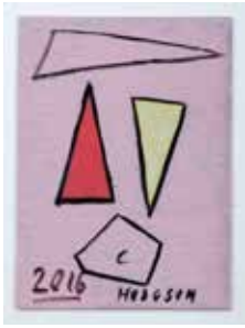
Untitled, 2016 acrylic on board 42 x 30,5 cm unique