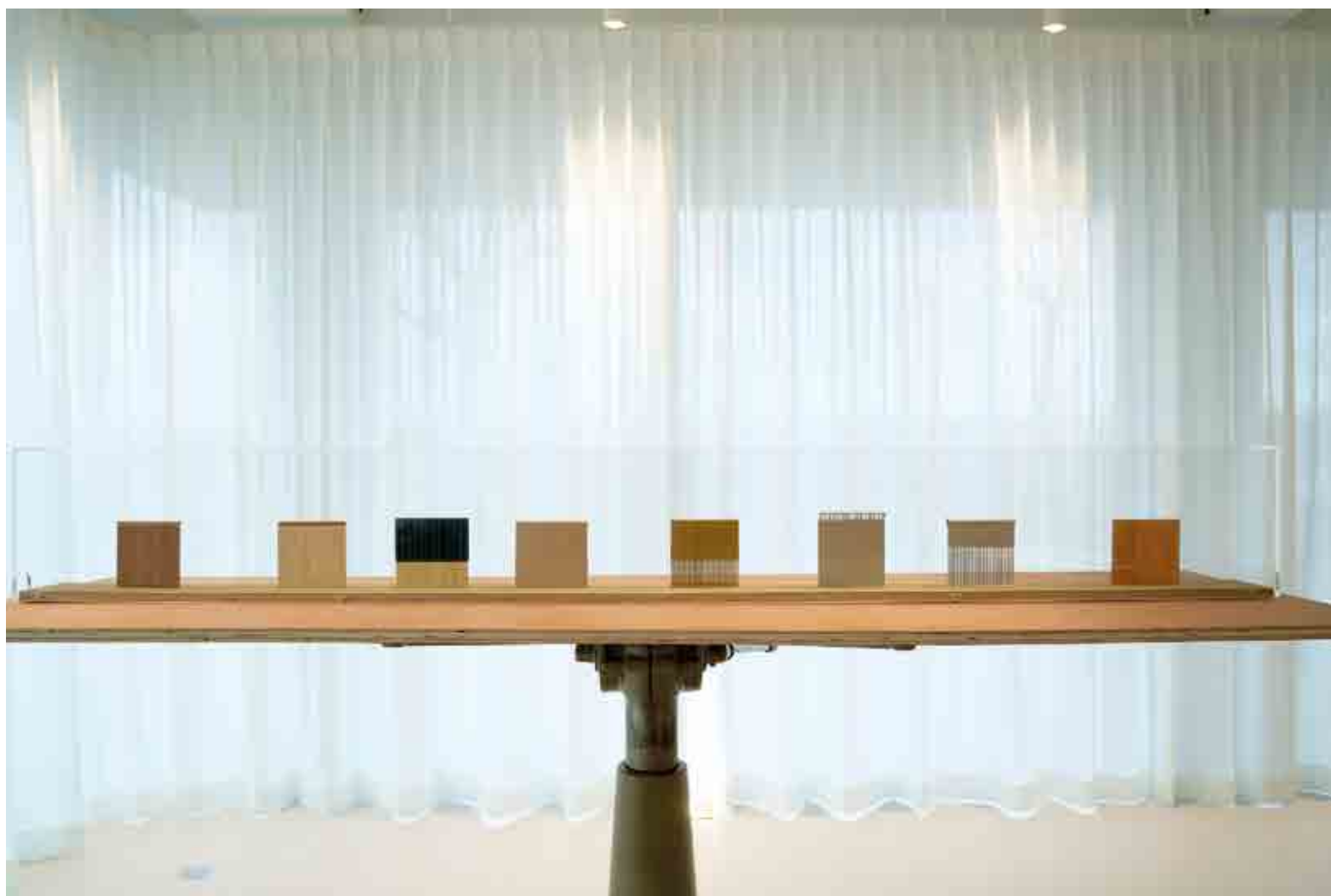
Luc Deleu, 'Eight Walls', foto Dirk Pauwels

'Het idee is ontstaan toen ik op televisie zag dat Trump acht prototypes aan het bouwen was, om te kiezen welke hij zou nemen. Wat hij er mee heeft geleerd is dat ze onderaan doorzichtig moeten zijn. Want bij een volle muur zie je niet wat ze aan de overkant doen'